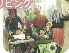
入所部門 リビング

ウォーターベッドの上でゆっくり揺れるのを楽しんだり、きれいな光や色の映像が見られて、とてもリラックスできます。